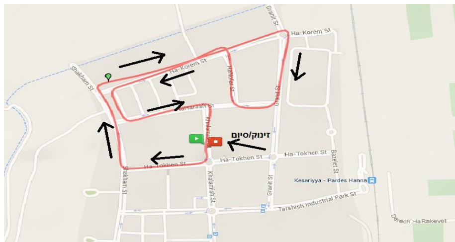
אורך הקפה: 3.3 ק"מ.